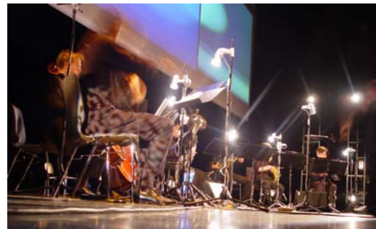
Vagues Sombres / La Danza Inmovil, 2004