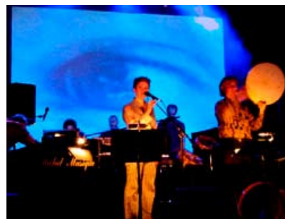
Short Connection 2003