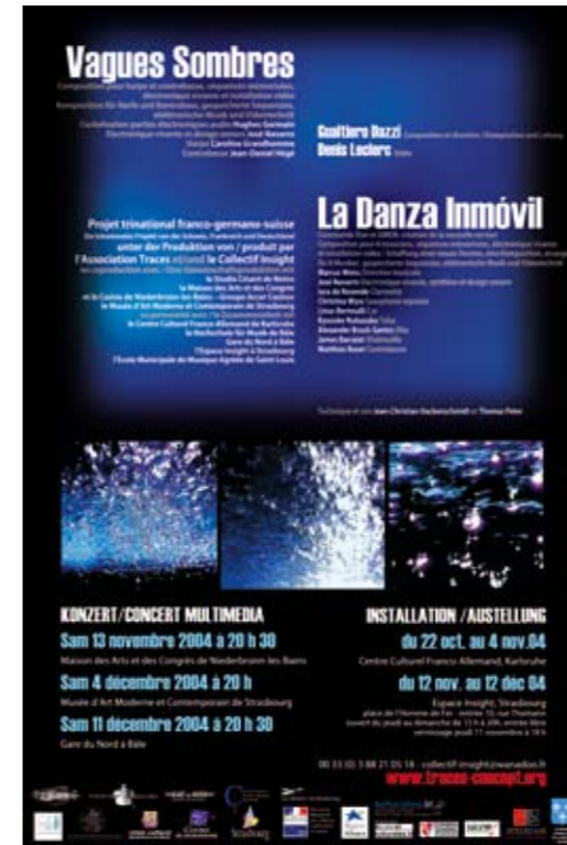
La Danza Inmovil